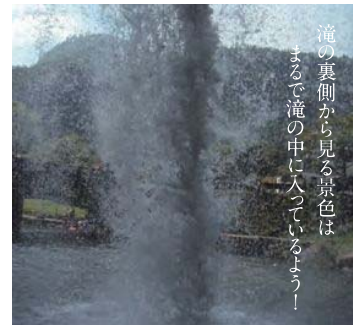
滝の裏側から見る景色はまるで滝の中に入っているよう！